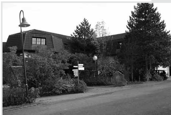
Abb. rechts: Eingangsbereich des Hotels.

15 Zimmer sind für uns unter dem Kennwort „AfM“ reserviert. Natürlich gibt es viel mehr Zimmer, aber hier ist immer recht viel los. Anmeldungen bis spätestens 15.03.2012 erbeten!