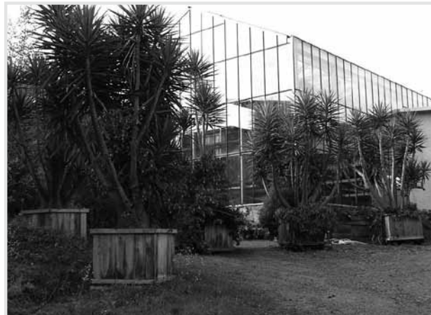
Abb. oben: Gewächshaus für Kübelpflanzen Abb. unten: Kleiner Kakteen- und Sukkulentengarten