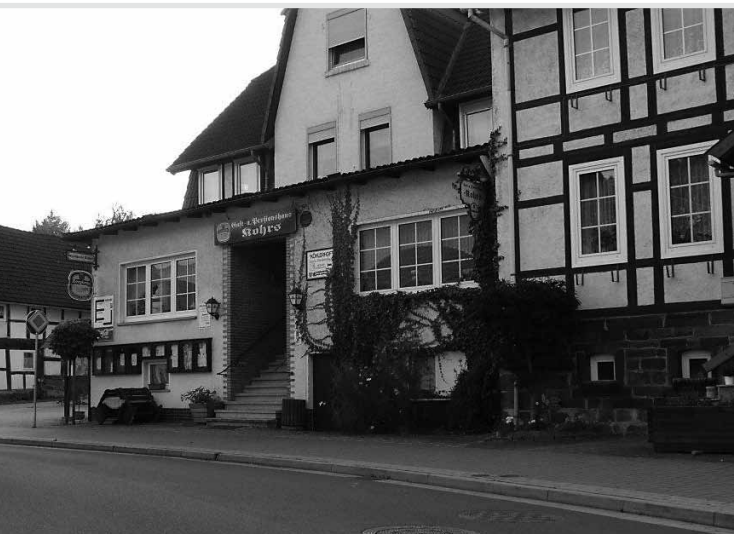
Eingangsbereich des Gast- und Pensionshauses Köhlerhof.

Gäste aus dem Osten nehmen die A 4 über Eisenach, oder die A 38. Die A 4 geht bei Kassel auf die A 7, die A 38 bei Drammetal auf die A 7. Beides Mal dieser in Richtung Hannover folgen und die oben erwähnte Abfahrt nehmen.