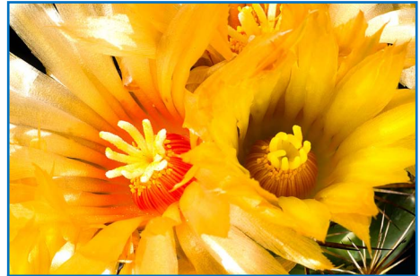
Coryphantha wohlschlagerei , Farbunterschiede bei der Blüte